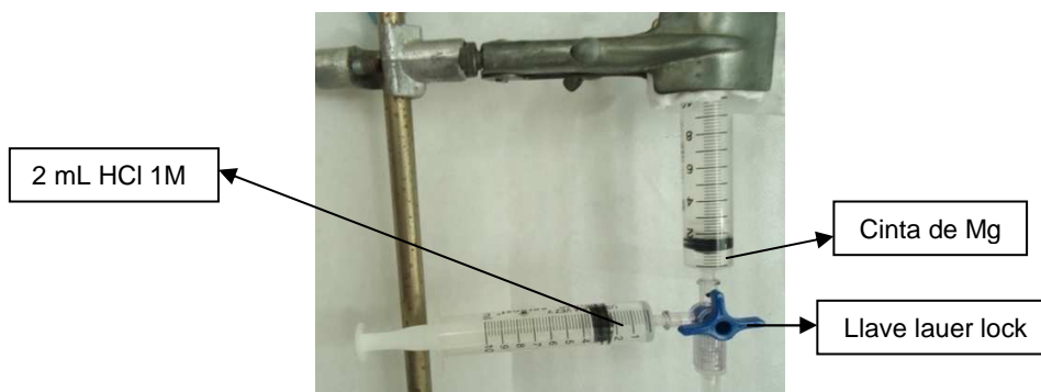
Figura 1. Dispositivo para obtención de gas hidrógeno.

Descripción: Se estudió la obtención de gas hidrógeno producto de la reacción entre ácido clorhídrico y magnesio. El dispositivo de reacción se armó con dos jeringas conectadas por una llave de conexión ( luer-lock) (ver Fig. 1).