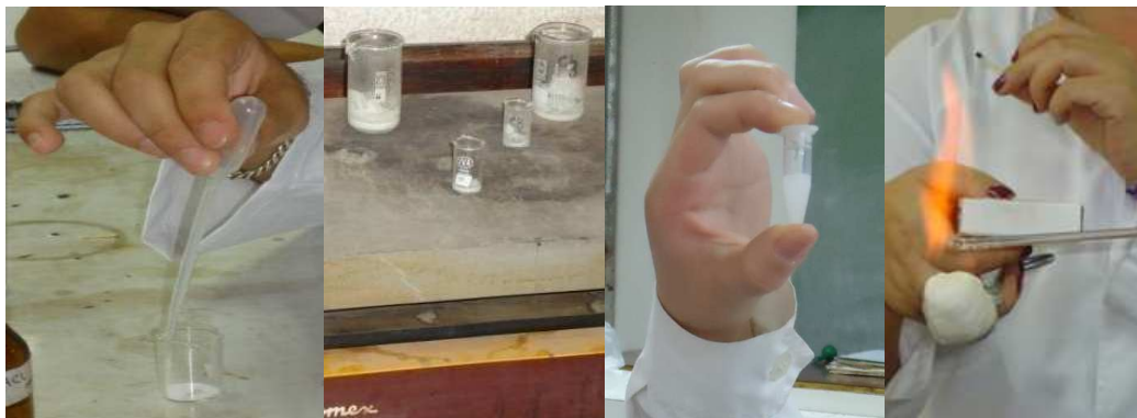
Figura 3: Obtención de NaCl y reconocimiento de la formación del mismo.